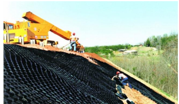
ESTABILIZACION DE TALUDES / CANALES