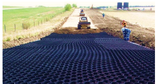
CAMINOS DE ACCESO / TERRACERIAS