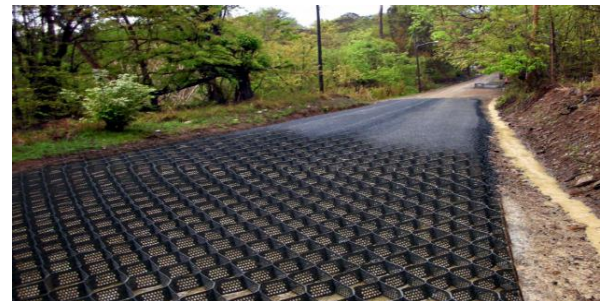
RECONSTRUCCION DE CARRETERAS